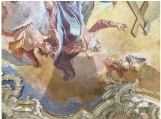
Prove di pulitura dell'affresco centrale e degli stucchi sopra l'altare.

Da un lato la pausa è stata causata dal blocco degli ultimi lavori nella navata, causati da un difetto esecutivo nella posa dei pavimenti di legno che ha portato a gravi deformazioni, tali da necessitare il loro totale rifacimento (spesa coperta dall'assicurazione RC). Quest'opera sarà iniziata ancora quest'anno assieme ad altre finiture della navata, così che il restauro di questa parte della chiesa sarà terminato per la Pasqua 2022.