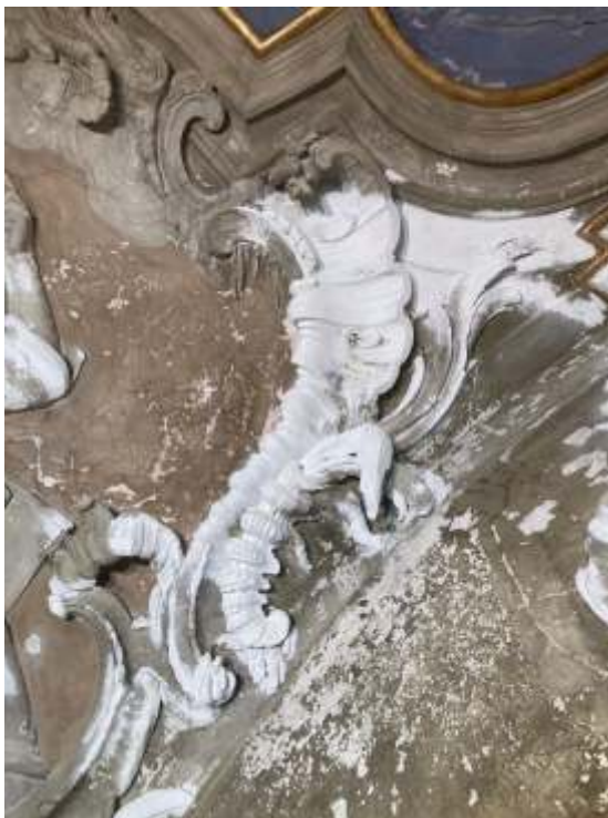
Elemento decorativo sopra l'altare restaurato.

Si prevede la preparazione di questi manufatti artistici all'inizio dell'anno prossimo e la loro messa in opera