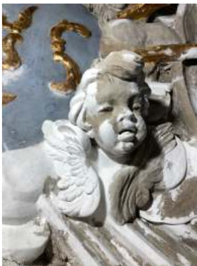
Putto nell'abside prima e dopo il restauro.